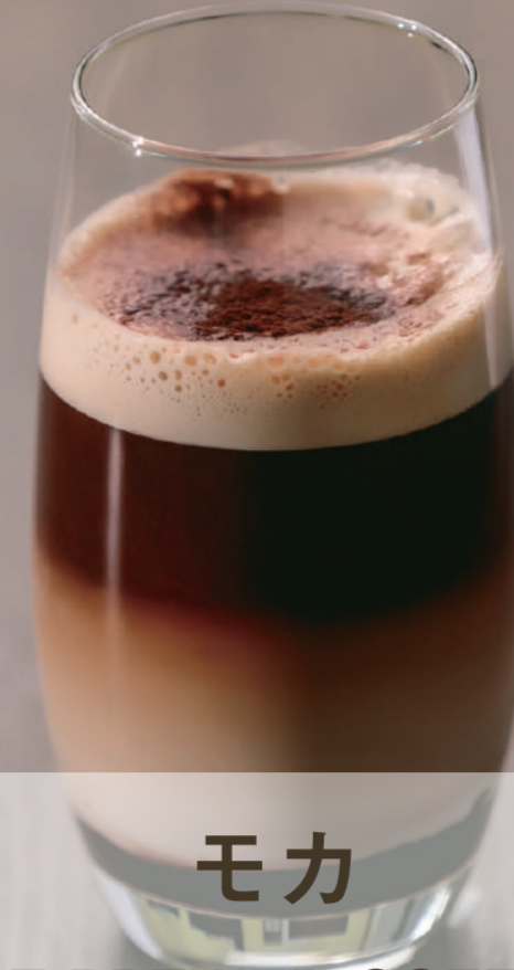
モカ ICE BREWED COFFEE × チョコレートソース