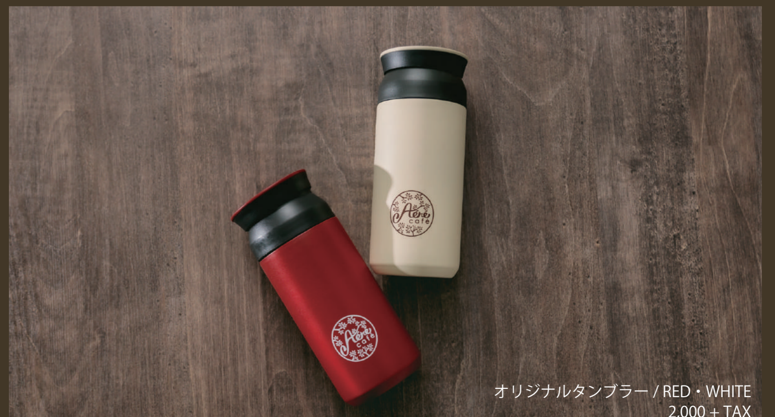
オリジナルタンブラー / RED・WHITE 2,000 + TAX