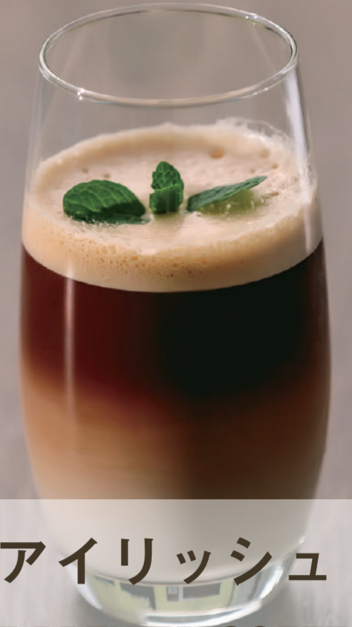
アイリッシュ ICE BREWED COFFEE × アイリッシュシロップ